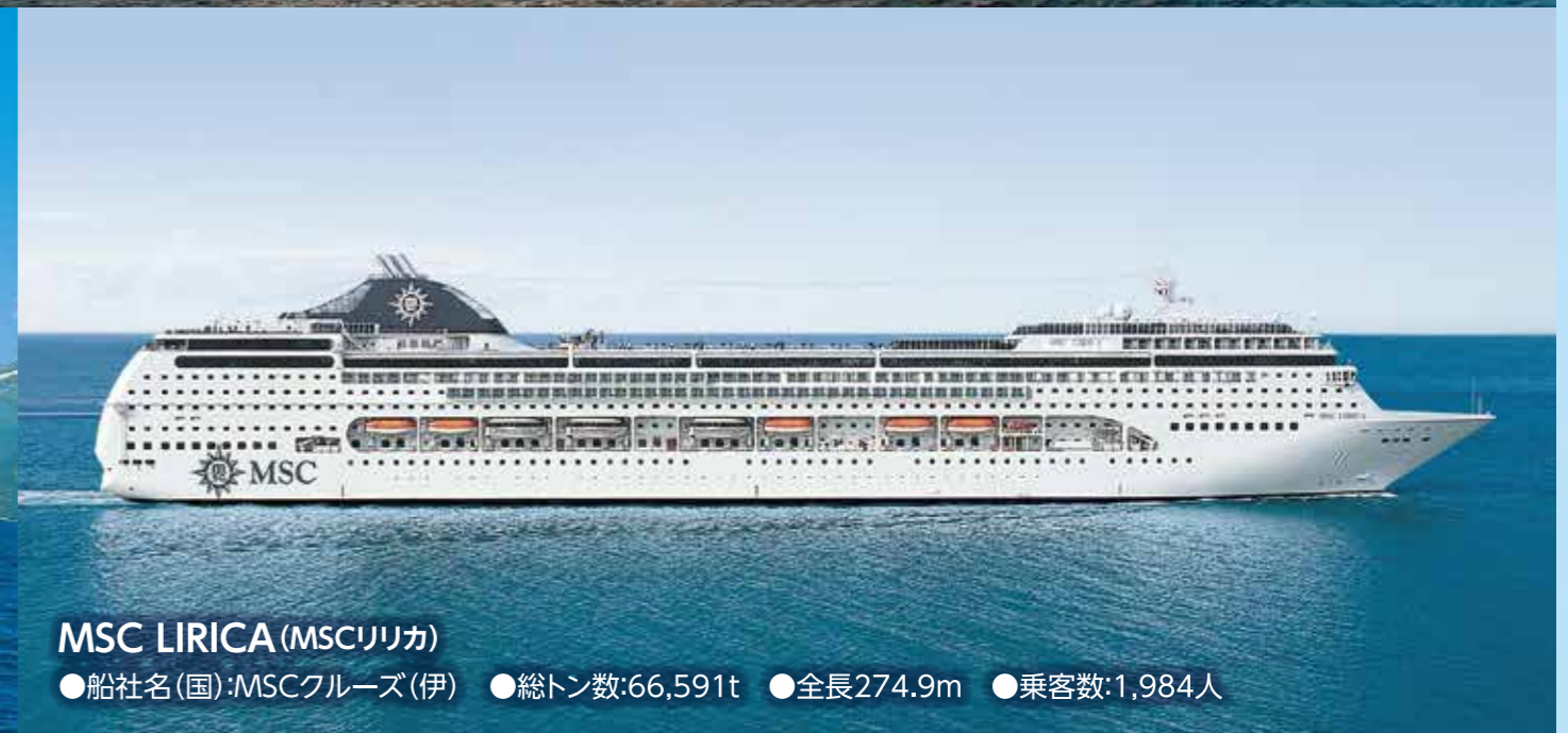
MSC LIRICA (MSCリリカ) ●船社名(国): MSCクルーズ(伊) ●総トン数: 66,591t ●全長: 274.9m ●乗客数: 1,984人