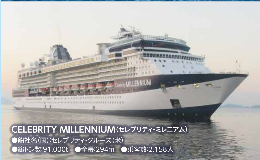
CELEBRITY MILLENNIUM (セレブリティ・ミレニアム) ●船社名(国): セレブリティ・クルーズ(米) ●総トン数: 91,000t ●全長: 294m ●乗客数: 2,158人