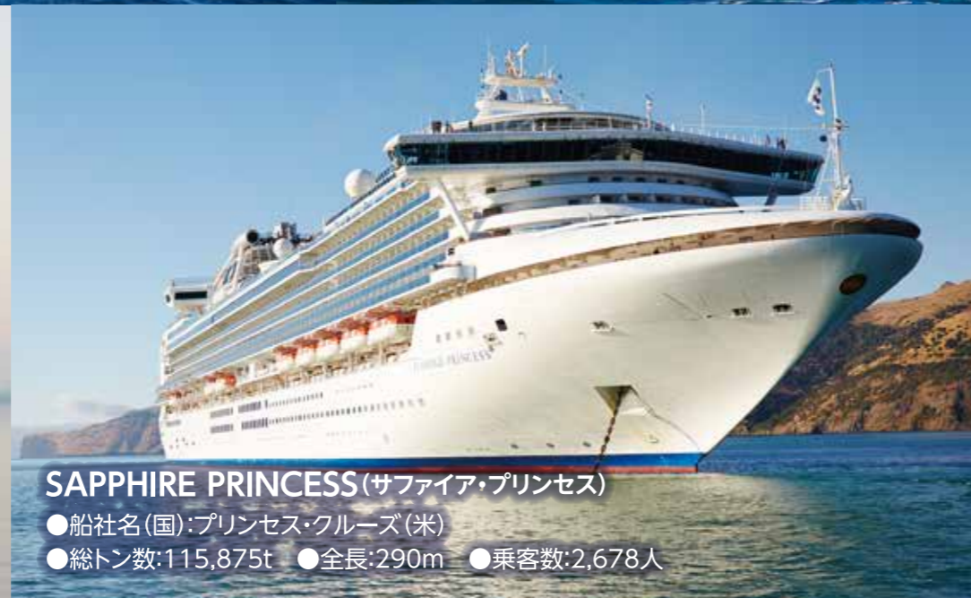
SAPPHIRE PRINCESS (サファイア・プリンセス) ●船社名(国): プリンセス・クルーズ(米) ●総トン数: 115,875t ●全長: 290m ●乗客数: 2,678人