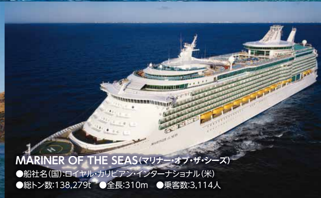
MARINER OF THE SEAS (マリナー・オブ・ザ・シーズ) ●船社名(国): ロイヤル・カリビアン・インターナショナル(米) ●総トン数: 138,279t ●全長: 310m ●乗客数: 3,114人