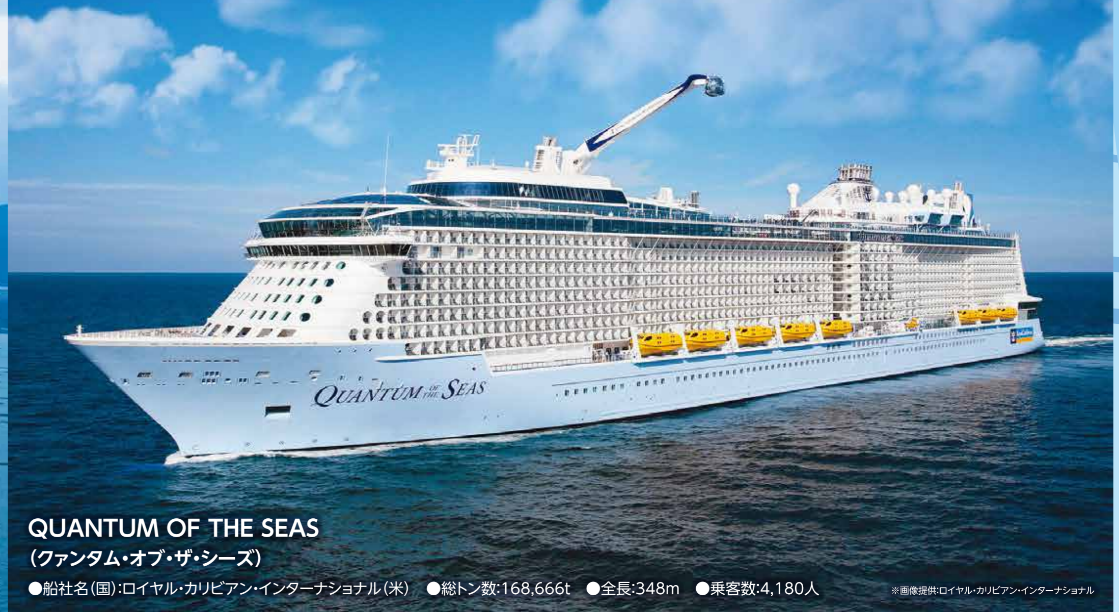
QUANTUM OF THE SEAS (ファンタム・オブ・ザ・シーズ) ●船社名(国): ロイヤル・カリビアン・インターナショナル(米) ●総トン数: 168,666t ●全長: 348m ●乗客数: 4,180人