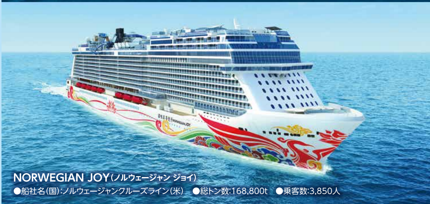
NORWEGIAN JOY (ノルウェー・ジャン・ジョイ) ●船社名(国): ノルウェー・ジャン・クルーズライン(米) ●総トン数: 168,800t ●乗客数: 3,850人