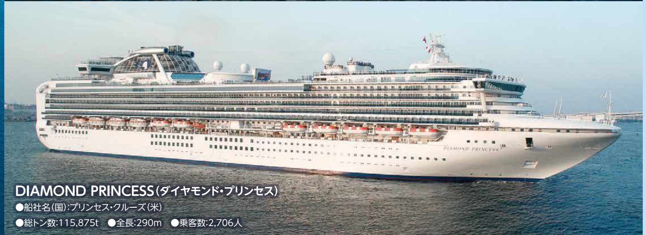
DIAMOND PRINCESS (ダイヤモンド・プリンセス) ●船社名(国): プリンセス・クルーズ(米) ●総トン数: 115,875t ●全長: 290m ●乗客数: 2,706人