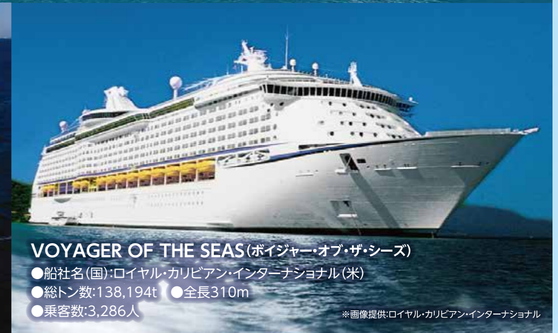
VOYAGER OF THE SEAS (ボイジャー・オブ・ザ・シーズ) ●船社名(国): ロイヤル・カリビアン・インターナショナル(米) ●総トン数: 138,194t ●全長: 310m ●乗客数: 3,286人