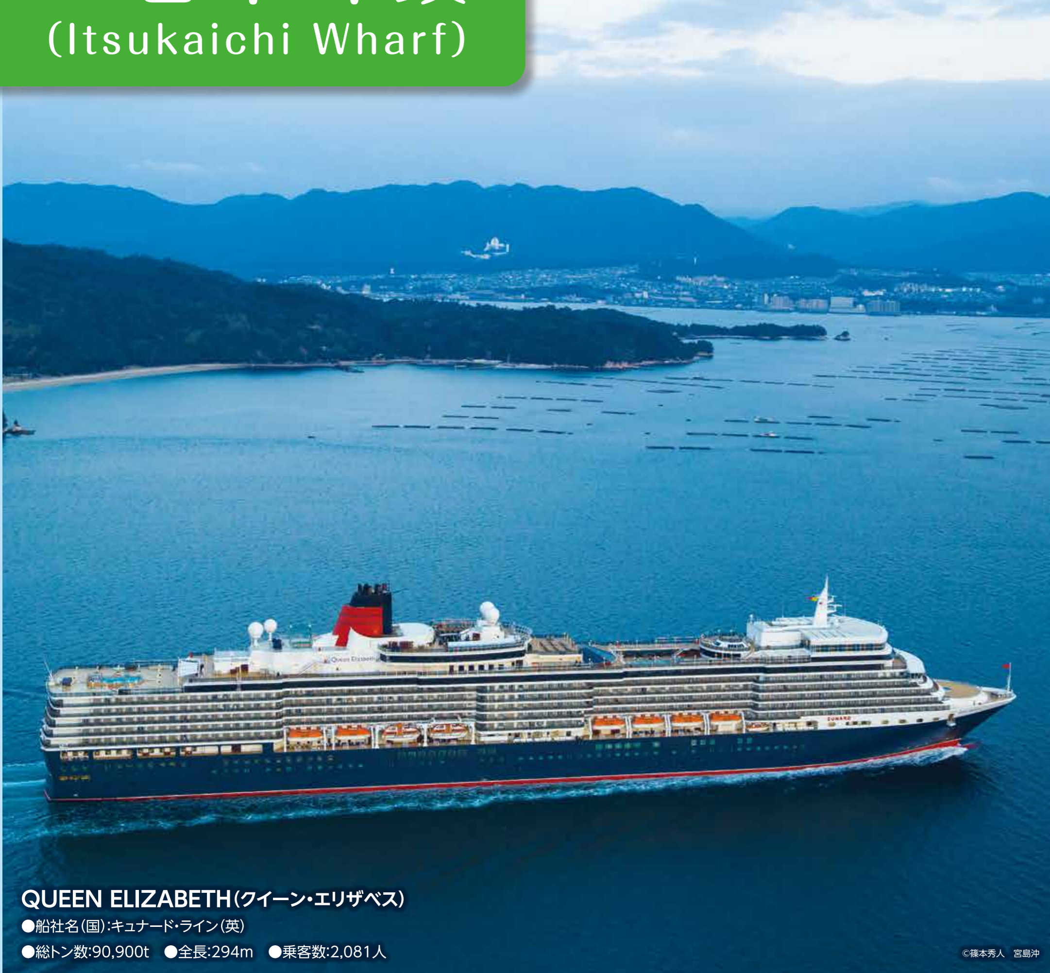
QUEEN ELIZABETH (クイーン・エリザベス) ●船社名(国): キュナード・ライン(英) ●総トン数: 90,900t ●全長: 294m ●乗客数: 2,081人