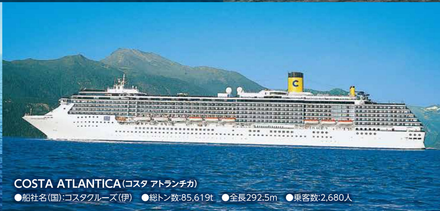
COSTA ATLANTICA (コスタアトランチカ) ●船社名(国): コスタクルーズ(伊) ●総トン数: 85,619t ●全長: 292.5m ●乗客数: 2,680人